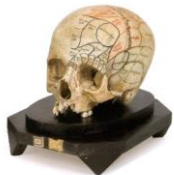
Museo di anatomia umana

foreste pluviali, alle savane e deserti dei tropici ed alle tundre e ghiacci polari. Tali collezioni, inoltre, rivestono un particolare interesse storico in quanto allestite da naturalisti ed esploratori umbri in gran parte vissuti nell'Ottocento, come ad esempio Orazio Antinori (1811-1882), che fu uno dei primi naturalisti-esploratori italiani ad addentrarsi nel cuore del continente africano.